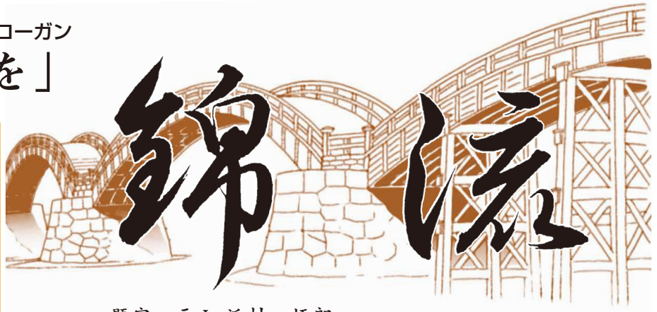
題字 元L 浜村 悟郎