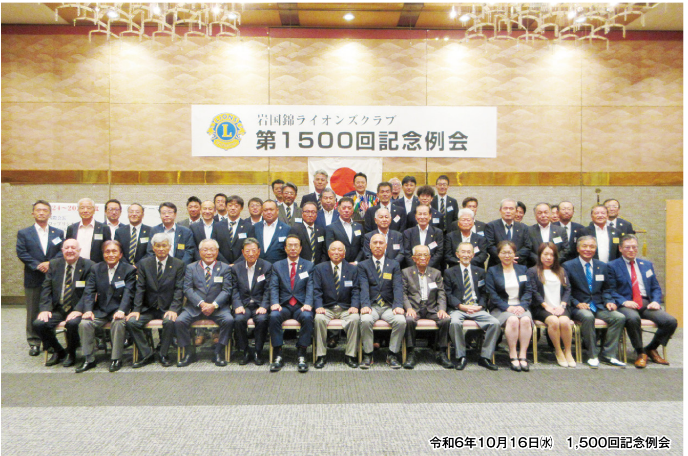
令和6年10月16日(水) 1,500回記念例会